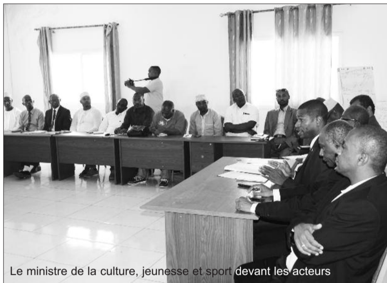
Le ministre de la culture, jeunesse et sport devant les acteurs

tente légitime et constructif, une commission de médiation sera mise en place. Elle sera dotée d'un petit budget pour faciliter sa mission. Le ministre enchaîne : « Désormais, les fédéra-