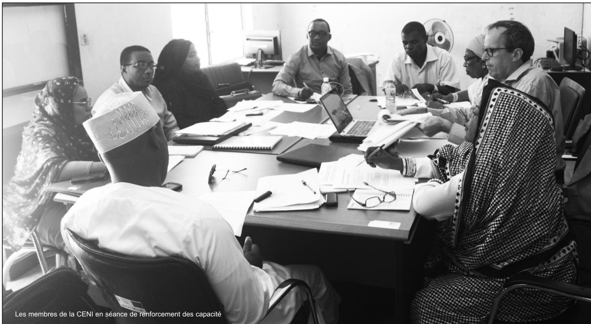
Les membres de la CENI en séance de renforcement des capacités

La Commission Electorale Nationale Indépendante travaille depuis des mois pour pondre un document sur leur expérience des dernières échéances électorales et par l'accompagnement d'un expert de l'ECES, produire un guide pratique des procédures électorales.