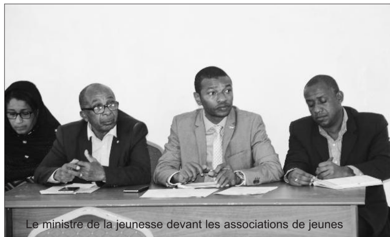
Le ministre de la jeunesse devant les associations de jeunes

« Ce sera une proposition de projet. Il sera soumis aux jeunes de chaque île et ensuite il y aura un atelier de validation de la politique nationale qui prendra en compte les amendements et propositions qui