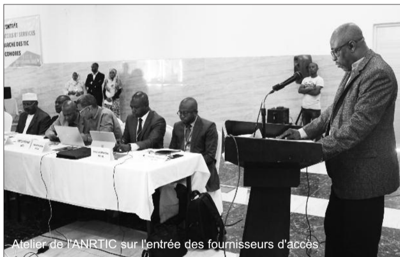
Atelier de l'ANRTIC sur l'entrée des fournisseurs d'accès